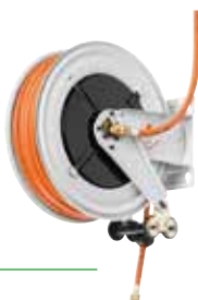
Avvolgitubo a molla per gas