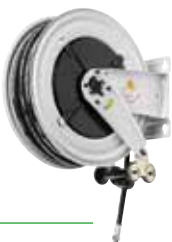
Avvolgitubo a molla per aria e acqua