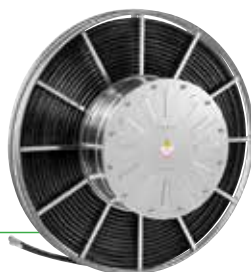
Avvolgitubo Idraulici Automatici A Molla