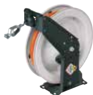
Avvolgicavo per messa a terra